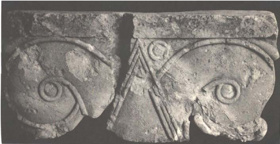
איור מספר 3: הכותרת הפרוטו-איאולית מחפירות קניון בריבוע AXVIII בעיר דוד.

גודלם הקטן במיוחד של החדרים שנחשפו על ידי קניון מצביע על כך שהם אינם שייכים לחומת סוגרים, אלא לחדרים הקטנים סביב החצר המרכזית בארמון.