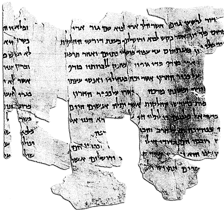
פשר נחום, 4Q169, טור א ותחילת טור ב

הכתיים בתיאורים אסכולוגיים (במדבר כד, כד ; דניאל יא, ל), חשוב היה לאנשי קומראן לזהותם. במאה השנייה לפסה"נ זיהו אנשי קומראן את הכתיים בסלווקים. זיהוי זה מתועד במגילת המלחמה, שמופיע בה הצירוף 'כתי אשור' (1QM, טור א, שורה 2), 40 וכן בפשר ישעיה א, המתאר את נפילת הכתיים ביד ישראל (4Q161, קטעים 8–10, טור ג, שורות 1–9). מאוחר יותר התברר לסופרי קומראן שיום ה' לא הגיע במהלך תקופת השלטון הסלווקי, והם החלו לזהות את הכתיים ברומאים. זיהוי זה מתועד פעמים אחדות בפשר נחום (4Q169, קטעים 3–4, טור א, שורות 3–4) ובפשר חבקוק (ראו למשל: 1QpHab, טור ב, שורה 12 – טור ג, שורה 13). 41 שינויים מסוג זה היו מאוד לא פשוטים כאשר הועלו הפשרים על הכתב, אך היו הרבה יותר קלים כשמדובר בתורה שבעל-פה. לפיכך ייתכן שהחל מאמצע המאה הראשונה לפסה"נ הפסיקו סופרי קומראן להעלות את הפשרים על הכתב, והסתפקו בהצבעה בעל-פה על משמעותם האקטואלית של נבואות ושל מזמורים מקראיים. 42